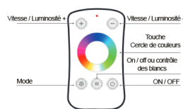
Table de changement de mode :